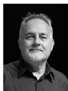
Furio Zanasi, baritono